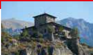
CASTELLO GAMBA Châtillon • Loc. Crêt-de-Breil T +39.0166 563252