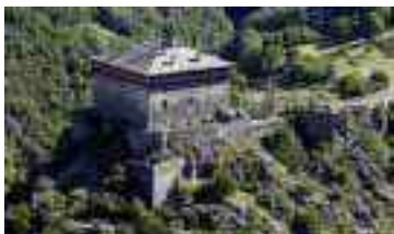
CHÂTEAU DE VERRÈS Verrès • Loc. Château T +39 0125 929067