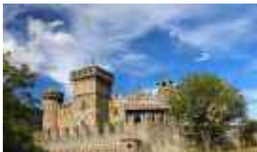
CHÂTEAU DE FÉNIS Fénis • Loc. Chez-Sapin T +39 0165 764263