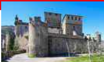
CHÂTEAU SARRIOD DE LA TOUR Saint-Pierre • Rue du Petit-St-Bernard T +39 0165 904689