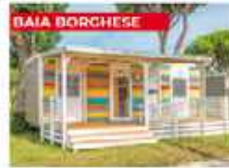
BAIA BORGHESE 4 24m² WC 1