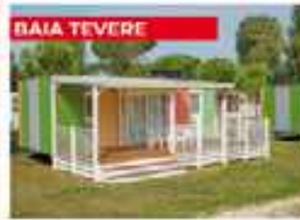
BAIA TEVERE 4 23m² WC 1