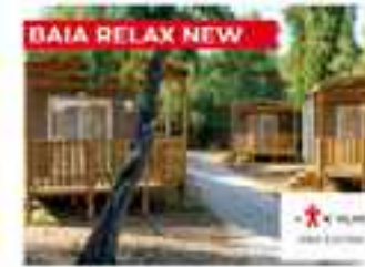
BAIA RELAX NEW 4+1 25,5m² WC 2