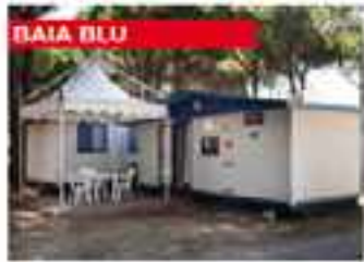
BAIA BLU 4 23m² WC 1

Der Preis beinhaltet Unterkunft und Übernachtungsgeld, Wasser-, Gas- und Stromverbrauch, Parkplatz in der Unterkunft, Pflanzenkügel und Decken, ein Frühstück mit Tee/Kaffee und Gebäck, das der Kapazität der Erholungsstätte entspricht.