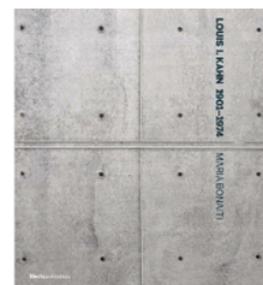
cliccare per info / click for info