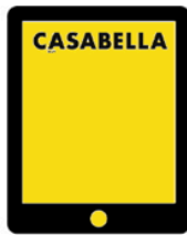
App per iPad e iPhone