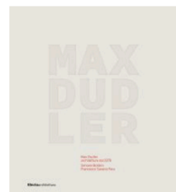
cliccare per info / click for info