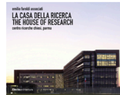
cliccare per info / click for info