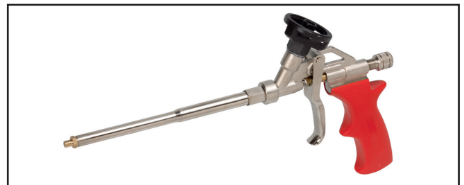
Pistola PU PLUS modello professionale codice 3785