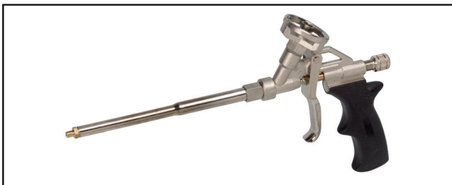
Pistola PU codice 3784