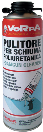
PULITORE PER SCHIUMA

Utilizzabile per rimuovere la schiuma non polimerizzata da