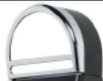
TESTINA SENZA LUCI