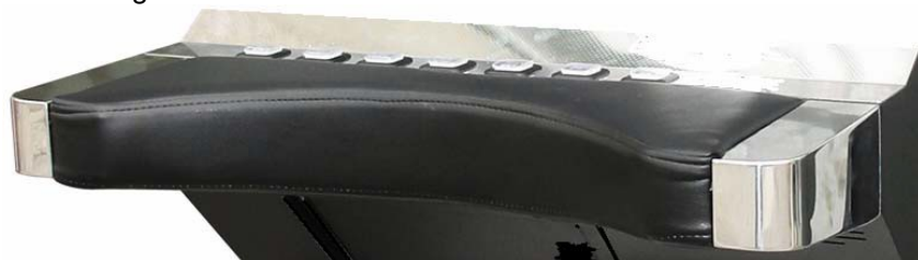
Plancia pulsanti alternativa con pelle nera

Dimensioni: Larghezza: 60 cm Profondità: 66 cm Altezza: 157 cm Peso: 80