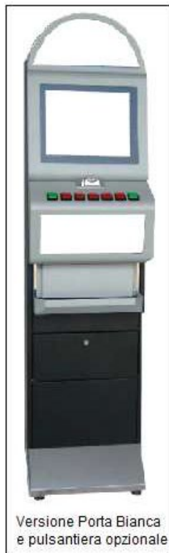
Versione Porta Bianca e pulsantiera opzionale