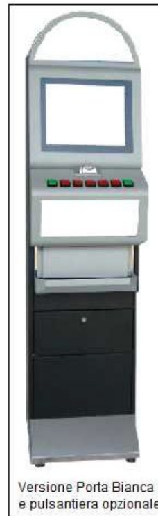
Versione Porta Bianca e pulsantiera opzionale

ALTEZZA 175 CM LARGHEZZA 45 CM PROFONDITA' 42 CM PESO 67 KG