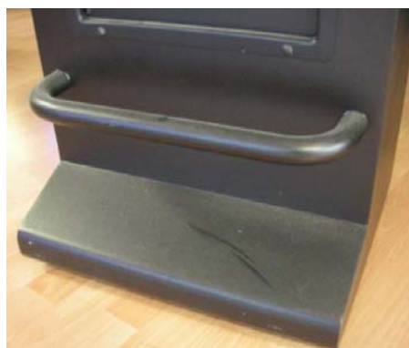
VARIANTE: POGGIAPIEDI E PEDANA VERNICIATI NERO