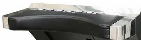
VARIANTE: PLANCIA PULSANTI ALTERNATIVA CON PELLE NERA

Larghezza: 60 cm Profondità: 66 cm Altezza: 157 cm Peso: 80 Kg