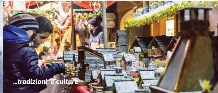
...tradizioni e culture