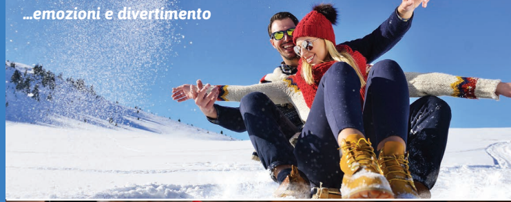
...emozioni e divertimento