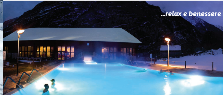
...relax e benessere