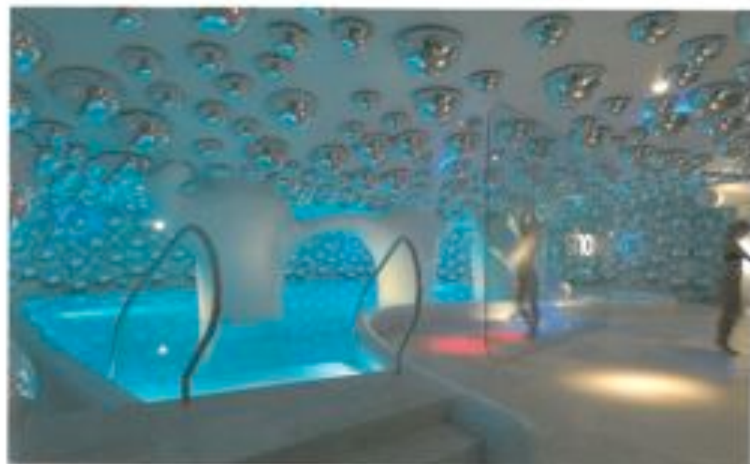
Hotel Excelsa in Milaan met 100 m² wellness. [pagina 96]