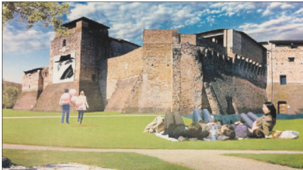
Un rendering della futura piazza Malatesta

RIMINI - Avanti tutta con il nuovo volto di piazza Malatesta. Col voto favorevole della maggioranza, l'astensione di tre consiglieri (Moretto e Giudici di Ncd e Brunori dell'Idv), il voto contrario del consigliere Tamburini (M5S), la terza commissione consiliare ha dato parere favorevole all'approvazione definitiva della variante al Prg per la riqualificazione di piazza Malatesta, già adottata dal consiglio comunale nell'ottobre scorso. La variante, che nei prossimi giorni sarà sottoposta al vaglio del consiglio per la sua definitiva approvazione, ha come obiettivo la riqualificazione della storica piazza riminese, "parte del progetto più ampio - ricorda il Comune con una nota - di valorizzazione, rigenerazione ambientale e rilancio turistico di quel quadrante di città che dal ponte di Tiberio passa le