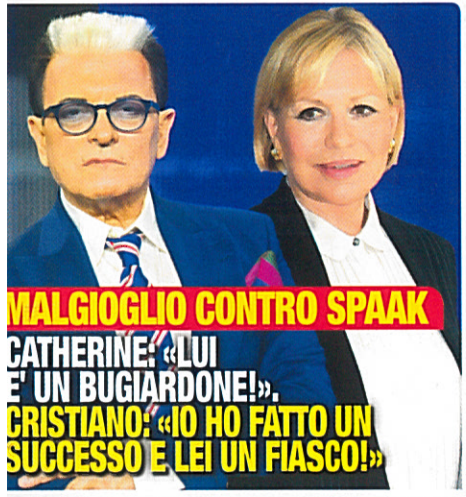
MALGIOGLIO CONTRO SPAAK CATHERINE: «LUI E' UN BUGIARDONE!». CRISTIANO: «IO HO FATTO UN SUCCESSO E LEI UN FIASCO!»