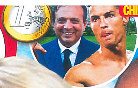
PIERO (CR4) "ATTACCA" CRISTIANO (CR7) MENTRE LUI E' NELLA BUFERA