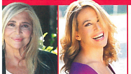
VENIER CONTRO D'URSO RETROSCENA DELLA DURA GUERRA TRA LE SIGNORE DELLA DOMENICA. LE AMICHE-NEMICHE NON SI RISPARMIANO UN COLPO!