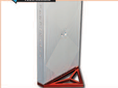
OMEGA AUDIO ESSENZIALE