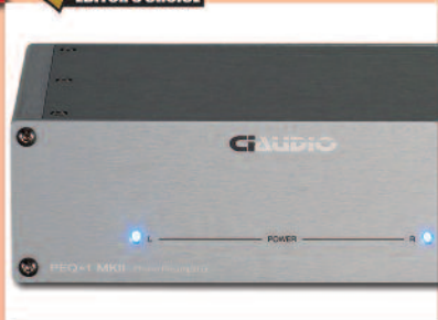
CIAUDIO PEQ-1 MKII