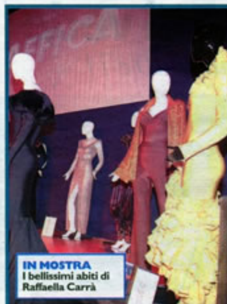
IN MOSTRA I bellissimi abiti di Raffaella Carrà

BELLARIA I VESTITI DI SCENA DELLA CARRÀ: IL SINDACO TAGLIA IL NASTRO AL PIAZZA