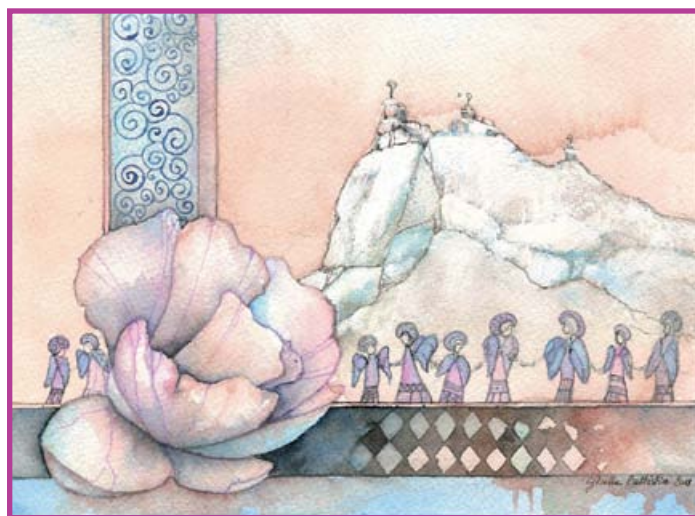
Piccolo dipinto creato per Aslem dall'artista Gisella Battistini

I ragazzi che hanno partecipato al torneo di Biathlon