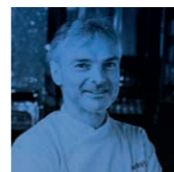
SILVER SUCCI Quartopiano Suite Restaurant Rimini